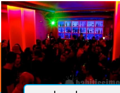
...un bar de copas