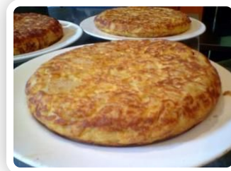
una ración de tortilla (para compartir)