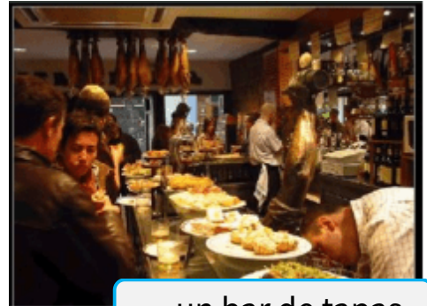
... un bar de tapas