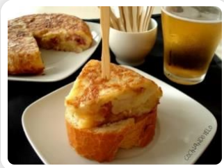
un pincho de tortilla (para mí solo)